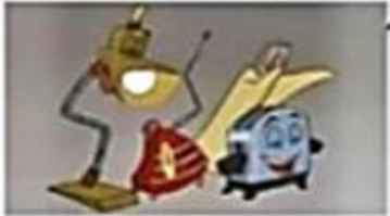
Doña Tostadora celebrando su hazaña.

Doña Tostadora demostró una vez más, ayer por la mañana, que es la mejor de su categoría tostando el pan del desayuno. Consiguió, en solo tres minutos, un dorado especialmente apetitoso del pan integral. Toda una proeza, dado que el pan tenía tres días ya. Desde nuestro periódico nos gustaría felicitar a Doña Tostadora por su labor y animarla a que siga así durante muchos años.