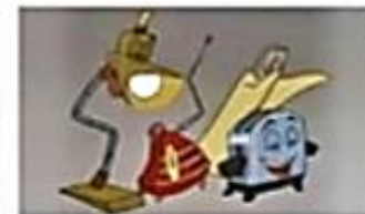
Doña Tostadora celebrando su hazaña.

Doña Tostadora demostró una vez más, ayer por la mañana, que es la mejor de su categoría tostando el pan del desayuno. Consiguió, en solo tres minutos, un dorado especialmente apetitoso del pan integral. Toda una proeza, dado que el pan tenía tres días ya. Desde nuestro periódico nos gustaría felicitar a Doña Tostadora por su labor y animarla a que siga así durante muchos años.