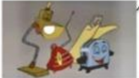
Doña Tostadora celebrando su hazaña.

Doña Tostadora demostró una vez más, ayer por la mañana, que es la mejor de su categoría tostando el pan del desayuno. Consiguió, en solo tres minutos, un dorado especialmente apetitoso del pan integral. Toda una proeza, dado que el pan tenía tres días ya. Desde nuestro periódico nos gustaría felicitar a Doña Tostadora por su labor y animarla a que siga así durante muchos años.