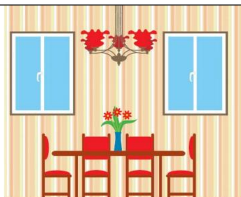
DINING ROOM (comedor)