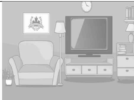
LIVING ROOM (la sala)