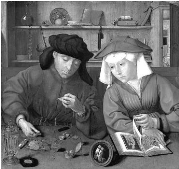
“El cambista y su mujer” (1514) de Quentin Massys.

8. ¿Qué características de la Europa de fines de la Edad Media representa la imagen?