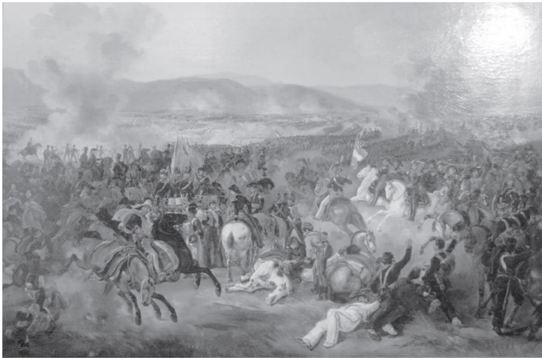
La Batalla de Maipú, por Mauricio Rugendas.

Bernardo O'Higgins, Libertador de Chile, exclamó antes de una batalla a sus soldados: " ¡Vivir con honor o morir con gloria! ¡El que sea valiente que me siga!".